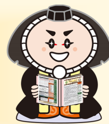
小松市イメージキャラクター「カブッキー」